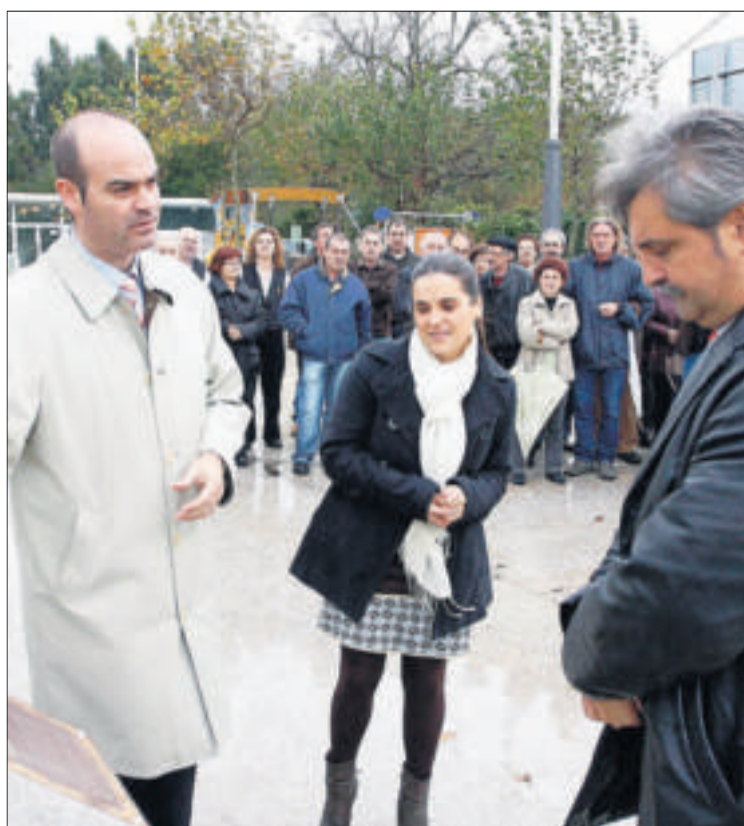
Otro momento del acto. // Carmen Giménez