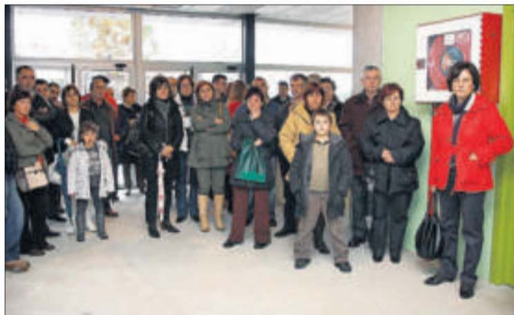
Asistentes al acto dentro del pabellón de Beluso. // Carmen Giménez