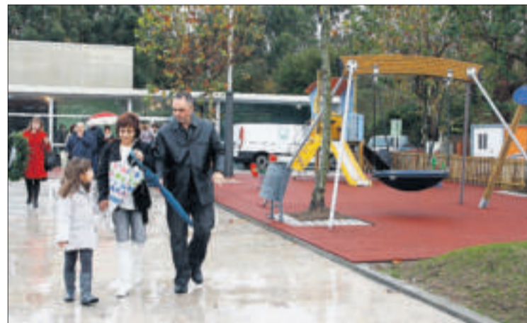
Una vista del parque en la nueva plaza. // Carmen Giménez