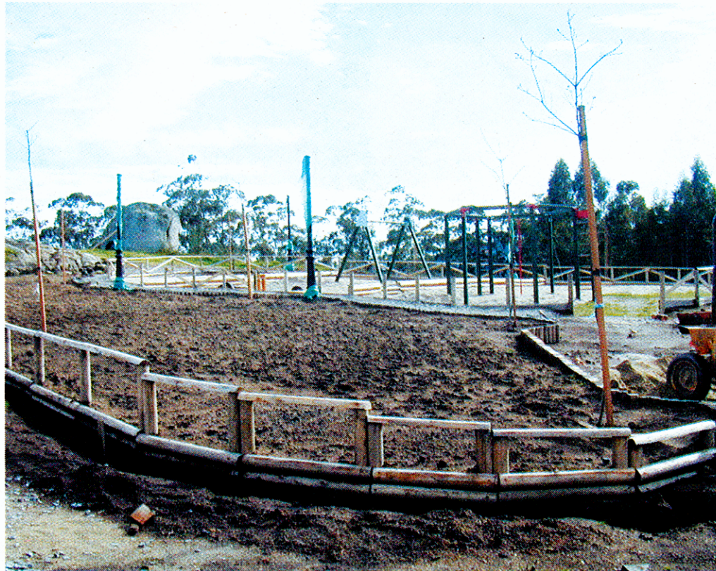
Vista del nuevo espacio de ocio en Chan do Piñeiro, parroquia de Beluso.

La decisión de adjudicar a este espacio el nombre de José Novas surgió de un acuerdo plenario celebrado un año atrás (coincidiendo con el fallecimiento de Novas), en el que